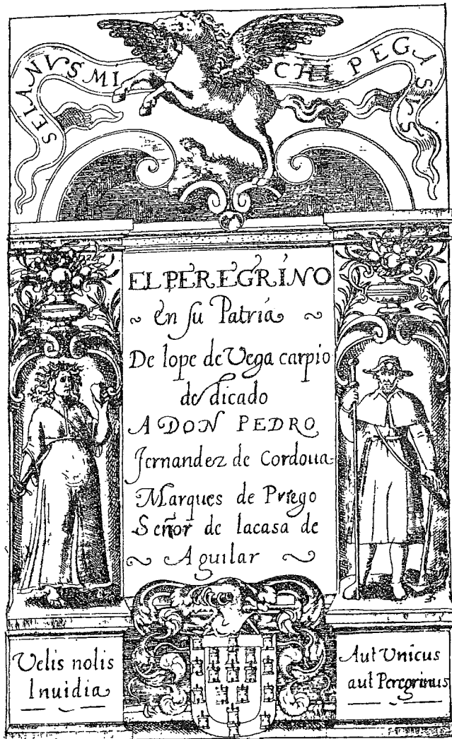
Núm. 781 del Catálogo.

taños, sonetos, etc.) que se publicaron en esta ocasión por primera vez.